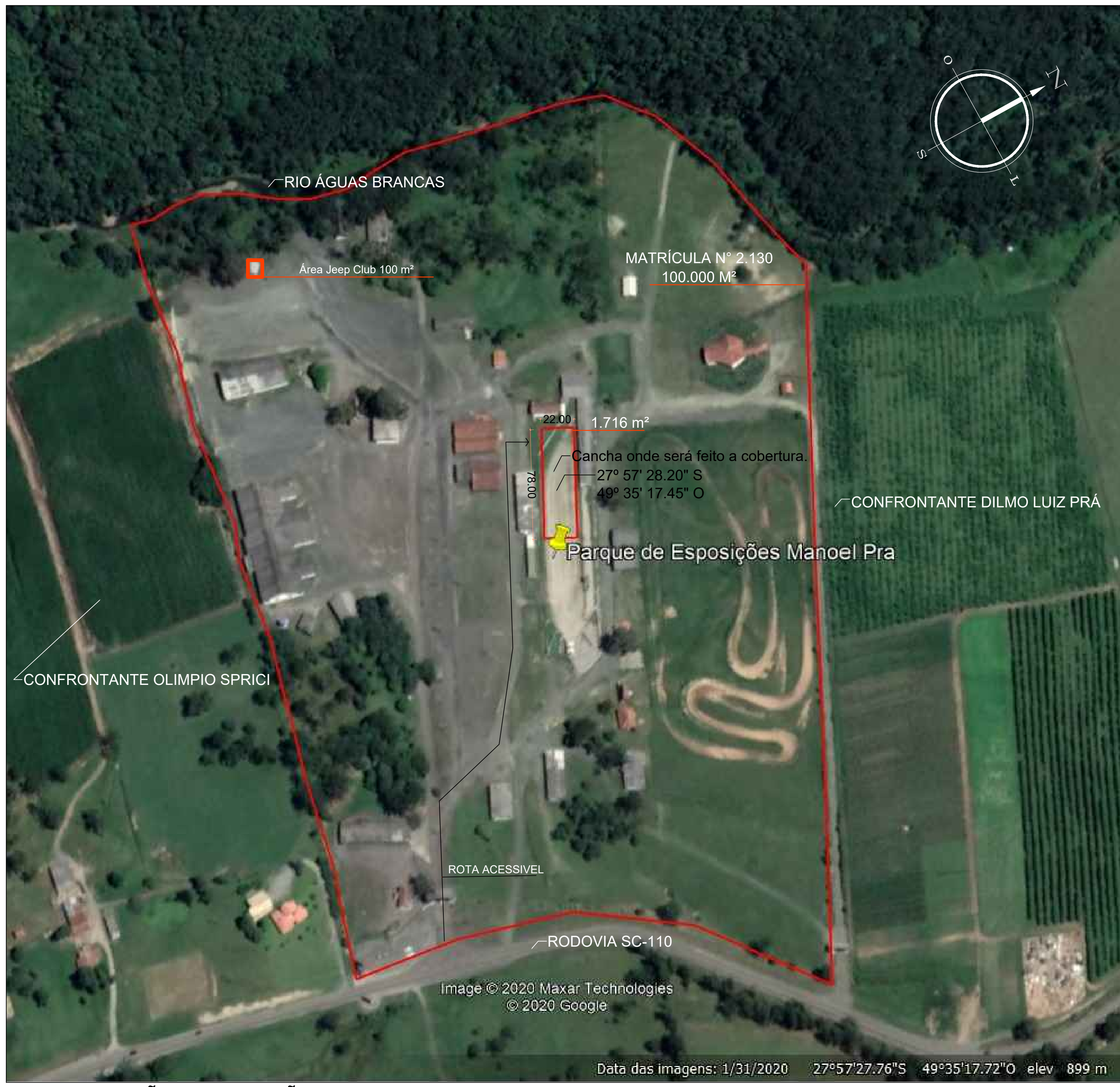
LOCALIZAÇÃO E SITUAÇÃO